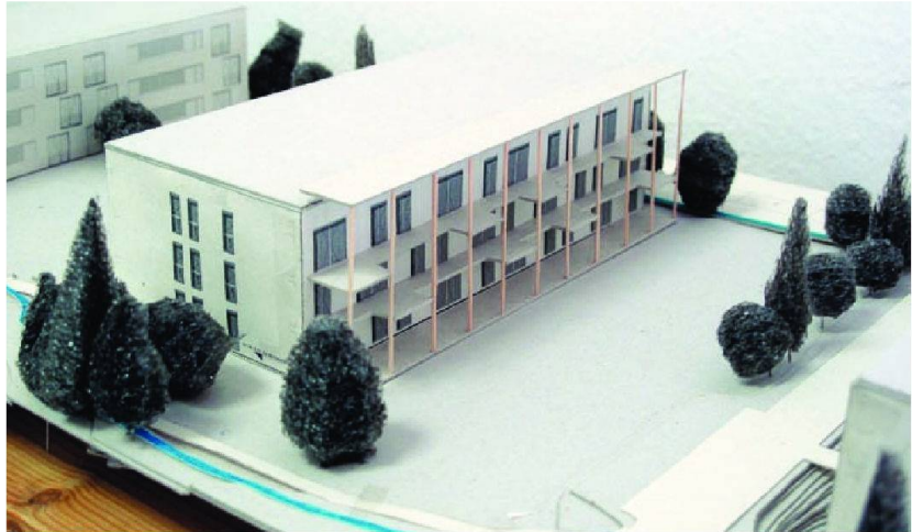
Le projet de la FPLC.

A l'occasion du départ d'un membre du comité – qui avait rendu de très précieux services pendant de longues années – de la petite Coopérative