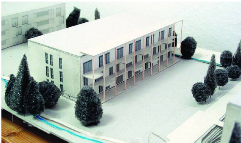
Le projet de la FPLC.

A l'occasion du départ d'un membre du comité – qui avait rendu de très précieux services pendant de longues années – de la petite Coopérative