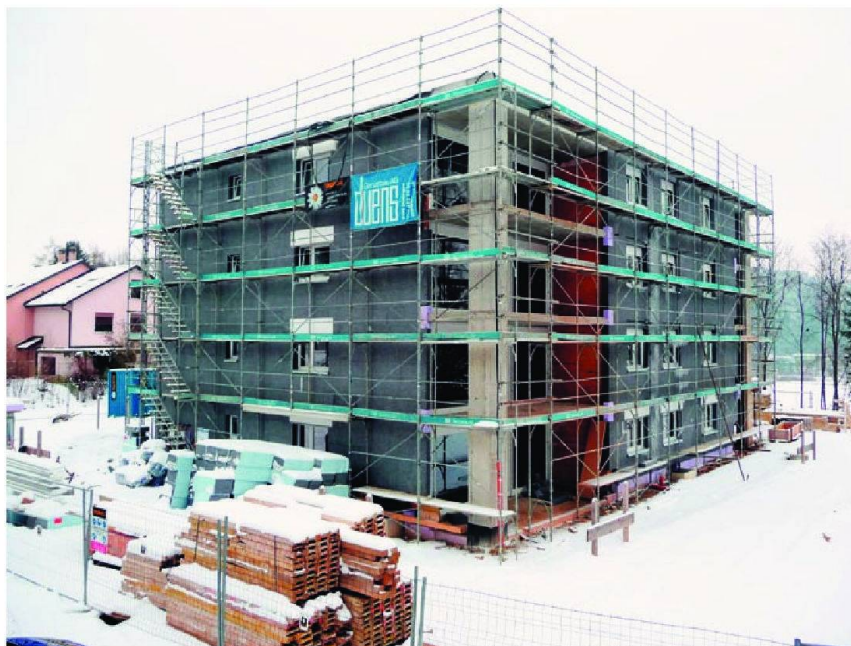
LSR Logement Social Romand SA.

La Fondation pour la promotion du logement bon marché et de l'habitat coopératif FPLC créée dans le canton de Genève a mis à disposition de trois coopératives une grande parcelle de terrain à bâtir à Confignon, tout