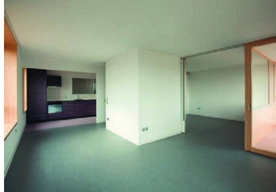
L'intérieur sobre et lumineux d'un appartement de la fondation Les Baumettes. © Terrin Barbier architectes/DR

bénéfice – ce n'est d'ailleurs pas le but. Mais pour en arriver là, nous devons proposer les 9 trois pièces que compose notre projet sur le marché libre.»