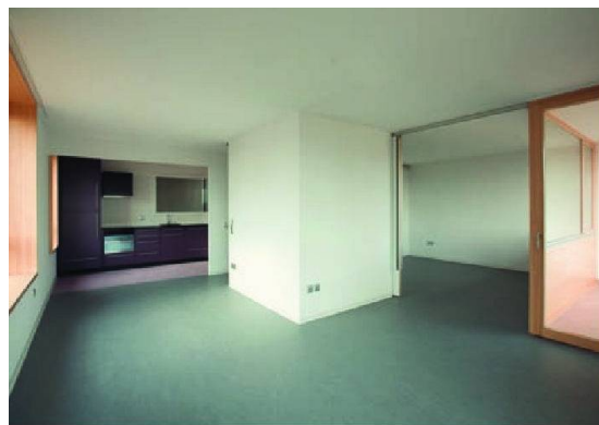
L'intérieur sobre et lumineux d'un appartement de la fondation Les Baumettes. © Terrin Barbier architectes/DR

bénéfice – ce n'est d'ailleurs pas le but. Mais pour en arriver là, nous devons proposer les 9 trois pièces que comporte notre projet sur le marché libre.»