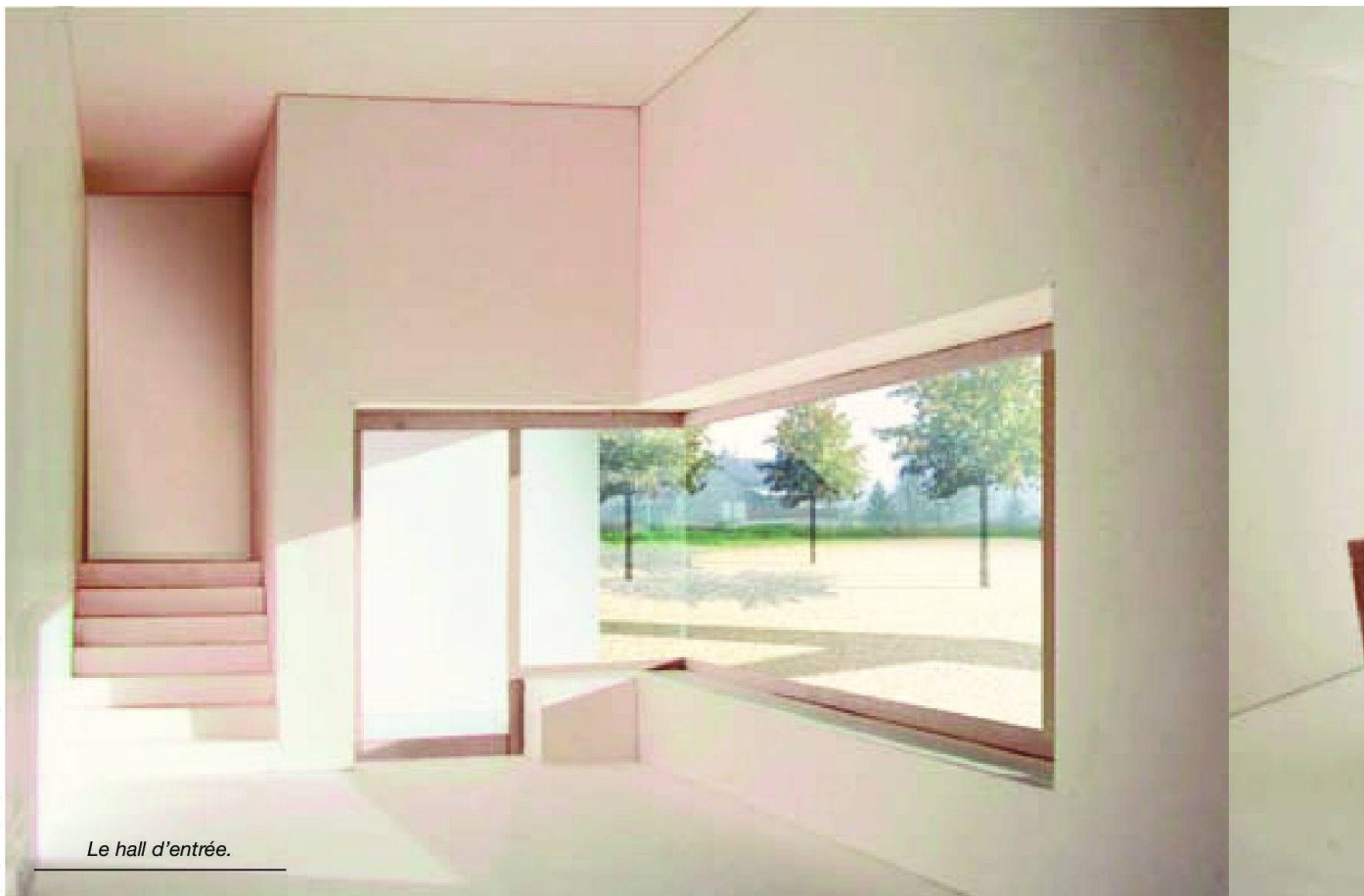
Le hall d'entrée.

L'autorisation de construire est arrivée à la commune le 20 mars dernier; la demande avait été déposée en août 2008. De son côté, le Conseil communal a voté le crédit d'investissement nécessaire. A l'unanimité. Du côté des finances communales, on a veillé à ce que l'opération ne paralyse pas tout futur projet, pour cause de surendettement. «Dans la réflexion, nous avons pris garde de toujours maintenir des finances saines afin que les futures autorités conservent une marge de manœuvre pour des projets à venir» explique le maire.