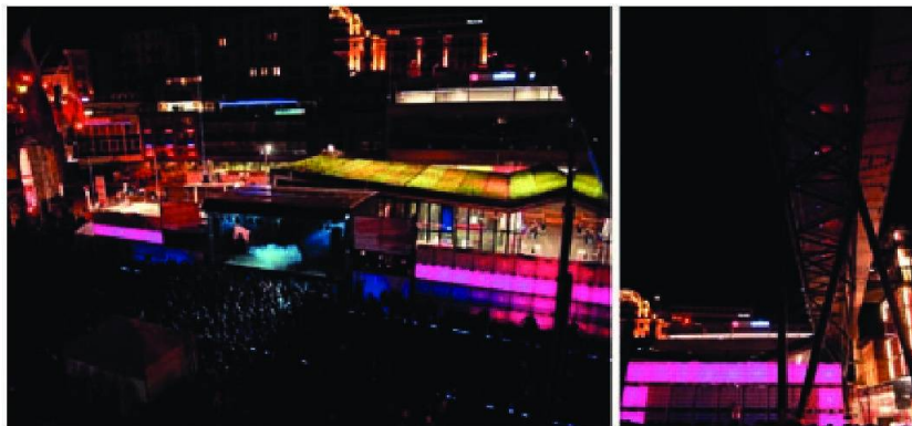
Installation urbaine / Label Suisse & M2 / Lausanne 2008.

Installation vidéo & lumière pour la piscine d'un chalet de luxe en Valais 2008. Architecte intérieur: Adeli & De Rahm / Lausanne-Dubaï.