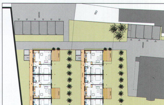
La villa transformée fera écran entre la route et les nouveaux immeubles. L'architecte entend consacrer un gros effort dans les aménagements extérieurs.