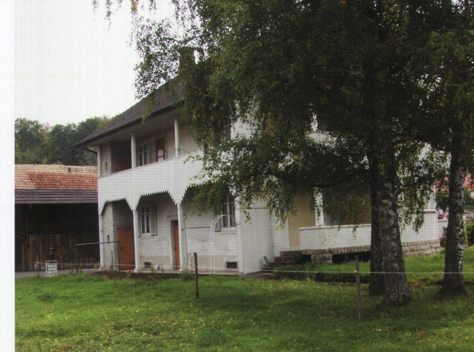
La commune avait acquis la parcelle en 2005. La villa sera transformée pour accueillir des logements adaptés et un appartement de fonction.