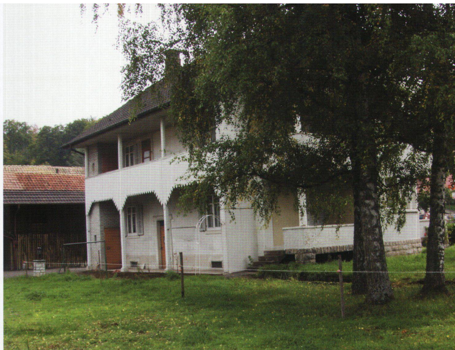
La commune avait acquis la parcelle en 2005. La villa sera transformée pour accueillir des logements adaptés et un appartement de fonction.