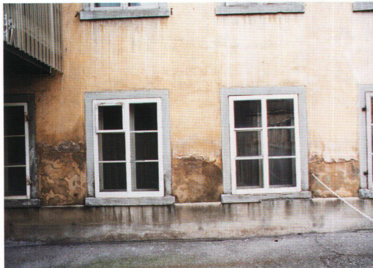
A cave humide, façade décrépie.