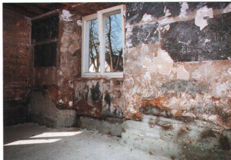
Première urgence: faire déterminer la cause par un expert.

silicone (hors classe de toxicité et sans solvants), ce qui va interrompre le transport de l'humidité. La résine se mélange à l'humidité dans les pores et le mélange prend dans les six heures qui suivent.