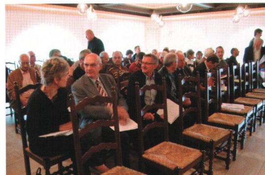
Les membres de l'ASH romande lors de l'AG à Yverdon-les-Bains.

La section romande devait également nommer pour une nouvelle période législative de 3 ans ses repré-