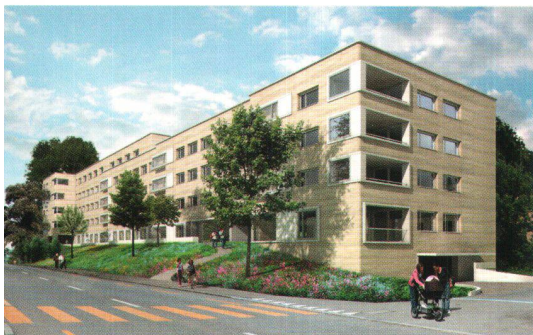
Coopérative Schönheim: construction de 33 logements à Zurich.

trafic routier et aérien à Kloten et y aménage 33 nouveaux logements spacieux. Les nouvelles constructions répondront au standard Minergie, avec aération de confort, chauffage aux granulés de bois/gaz et protection efficace contre le bruit. L'administration a attaché une grande importance au fait que pour tous les locataires actuels, un nouveau logement soit trouvé et elle a pu satisfaire généreusement cette exigence sous de brefs délais de résiliation, des aides au déménagement et autres prestations de soutien. Le Fonds de Solidarité contribue, par un prêt à conditions avantageuses de 990 000 francs, à ce que les nouveaux loyers restent modérés.