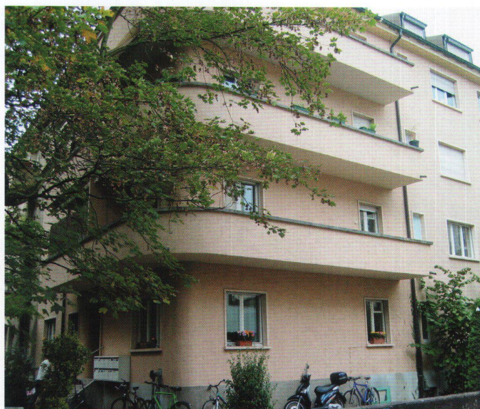
Wohnbaugenossenschaftsverband Nordwest: acquisition d'un immeuble locatif à Bâle.