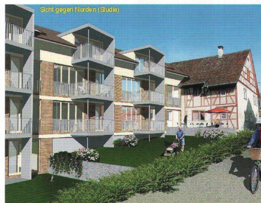
Wohnbaugenossenschaft im gwohnte Dörflingen: création de 11 logements pour personnes âgées.

La récente coopérative Wohnbaugenossenschaft im gwohnte Dörflingen nouvellement fondée a notamment pour but la promotion des intérêts des habitants âgés de la commune, par la construction de logements adaptés pour ceux-ci, avec soutien Spitex étendu. Grâce à l'appui généreux de la commune politique et de certains particuliers, la jeune coopérative peut maintenant réaliser sur un terrain remis en droit de superficie, dans la petite commune schaffouoise de Dörflingen, un premier projet comportant 11 logements. Il s'agit toutefois ici – exigence spéciale posée aux architectes – de conserver l'enveloppe de l'ancienne maison d'habitation avec grange attenante, ce pour des raisons de protection des monuments historiques. Le Fonds de Solidarité a donné son appui à ce projet par un prêt de 330 000 francs.