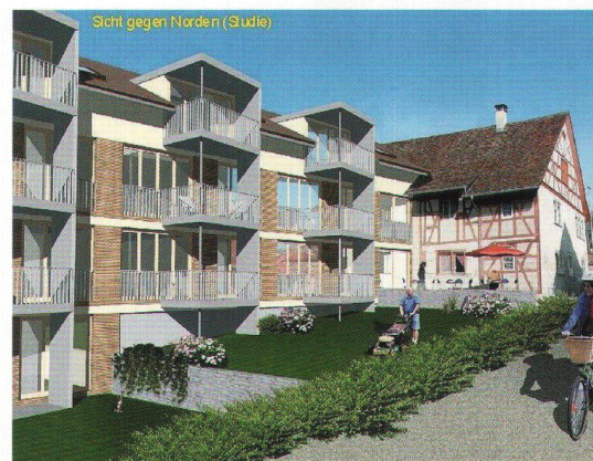
Wohnbaugenossenschaft im gwohnte Dörflingen: création de 11 logements pour personnes âgées.

La récente coopérative Wohnbaugenossenschaft im gwohnte Dörflingen nouvellement fondée a notamment pour but la promotion des intérêts des habitants âgés de la commune, par la construction de logements adaptés pour ceux-ci, avec soutien Spitex étendu. Grâce à l'appui généreux de la commune politique et de certains particuliers, la jeune coopérative peut maintenant réaliser sur un terrain remis en droit de superficie, dans la petite commune schaffhouse de Dörflingen, un premier projet comportant 11 logements. Il s'agit toutefois ici – exigence spéciale posée aux architectes – de conserver l'enveloppe de l'ancienne maison d'habitation avec grange attenante, ce pour des raisons de protection des monuments historiques. Le Fonds de Solidarité a donné son appui à ce projet par un prêt de 330 000 francs.