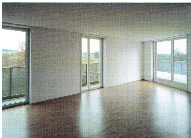
Les sols en parquet et les grandes portes-fenêtres donnant accès à la coursive et qui donnent des appartements baignés de lumière naturelle.

Avec des filtres fins dans les canalisations de ventilation, on obtient une excellente hygiène de l'air, et cette aération douce permet d'éviter des fuites incontrôlées d'air chaud ambiant. Du coup, l'habitat du Wolfswinkel gagne en efficacité énergétique: les bâtiments sont construits aux normes de Minergie, ce qui réduit la consommation énergétique de moitié. Mais il y a plus: des pompes à chaleur fournissent une énergie renouvelable tirée directement du sol et des panneaux solaires sur les toits fournissent de l'électricité au réseau. Le président de l'ABZ Peter Schmid estime que près de 80% des besoins énergétiques sont ainsi couverts par des sources d'énergie autonomes.