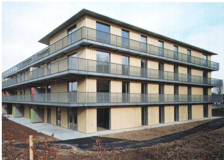
Le coffrage de façades en panneaux de bois peints en jaune et les coursives entourant les immeubles de part en part donnent une identité forte à l'ensemble.