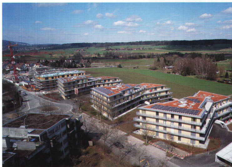
Le groupe d'habitations Wolfswinkel se situe à la limite de la ville et compte sept immeubles en forme de papillon.

Les bâtiments se font face de biais, délimitant ainsi des cours protégées de l'extérieur. On en trouve six en tout,