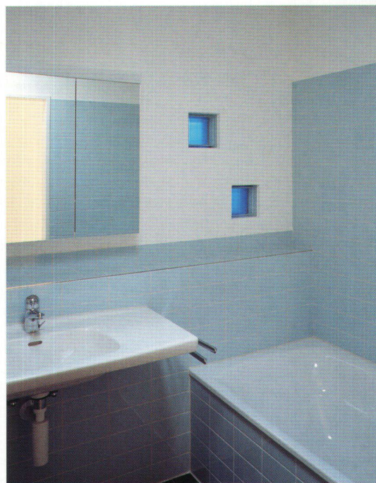
Les fameuses pierres de verre coloré qui donnent du charme à la salle de bains et qui identifient chaque appartement dans la cage d'escaliers.