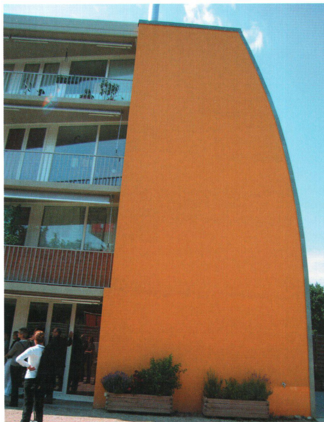
Cet immeuble de la coopérative INTI, en régime HM, compte 19 logements répartis selon 6 typologies différentes. Sa façade a été incurvée pour gagner en surface d'habitation au sol, tout en respectant la distance légale qui sépare le bâtiment de ses voisins.

Texte: Roger Dubuis , secrétaire général de l'ASH romande