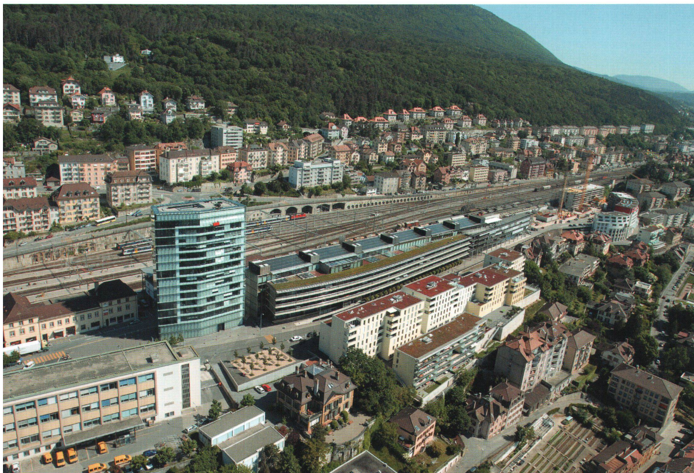
Le bâtiment de l'Office fédéral de la statistique à Neuchâtel.