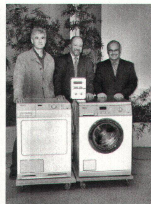
Les spécialistes MIELE et le secrétaire général.