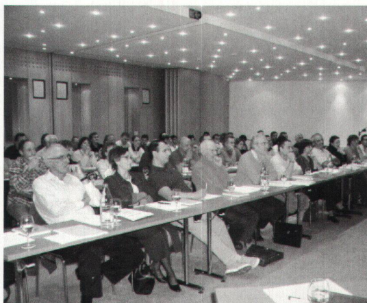
Des participants attentifs.

Un sondage a permis d'évaluer positivement ce cours et de mettre en évidence le besoin pour les participants de partager leurs préoccupations et d'être écoutés. Un cours conciergerie sera également organisé en 2007.