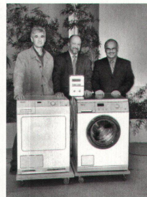
Les spécialistes MIELE et le secrétaire général.