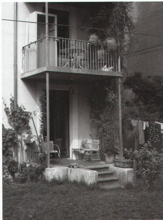
Vue sur un balcon donnant sur le jardin, avec la porte vitrée ouvrant sur la salle commune du rez