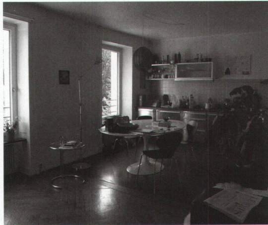
Cuisine ouverte, coin à manger et séjour constituent un espace généreux

Les travaux ayant duré assez longtemps en présence des habitants, chacun a plus ou moins souffert des nuisances, selon sa capacité de patience, mais tout le monde s'accorde à dire que le pire, c'était les échafaudages, qui bouchaient la vue durant toute la durée des travaux. Les autres interventions, comme par exemple le percement des sols pour faire passer les nouvelles tuyauteries pour le gaz, l'eau et la ventilation, étaient plus ponctuelles et donc moins lourdes à supporter. «On n'avait pas d'eau courante pendant un mois et demi d'affilée et il fallait s'approvisionner dans les appartements de l'autre moitié de l'immeuble. En plus, on n'a pas eu d'eau chaude pendant six mois. C'était super hard! », s'exclame Nathalie Qiu Desponds. Quant à Michael Hofer, c'est tout juste s'il s'en souvient et il ponctue les propos de Nathalie en abondant dans son sens, goguenard: «C'était extrême!» Eclats de rire.