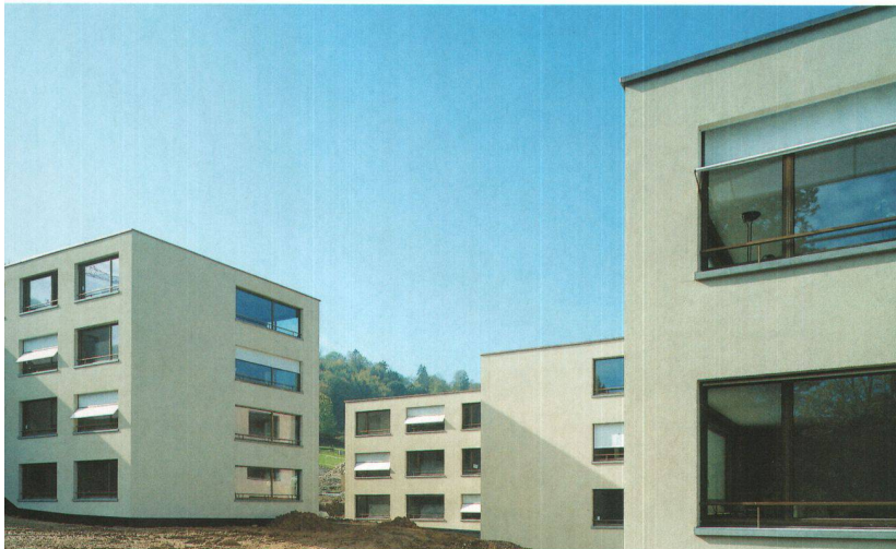
Le nouveau complexe résidentiel du Hagenbuchrain de la coopérative d'habitation Sonnengarten se trouve à Zurich Albisrieden, directement au pied de l'Üetliberg.