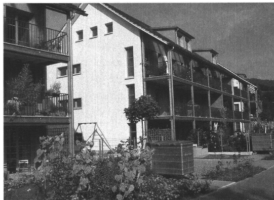
Locataires et propriétaires habitent sous un même toit dans l'ensemble résidentiel Minergie Hinterdorf à Dürnten ZH. Ce modèle a permis d'assurer le financement du projet.