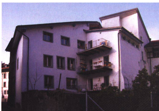
La façade est après la transformation