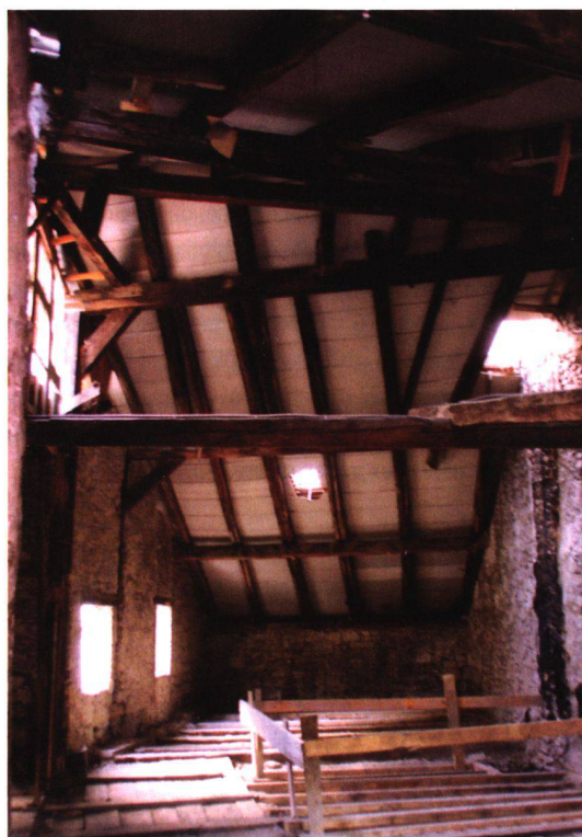
Les combles avant, pendant et après les transformations