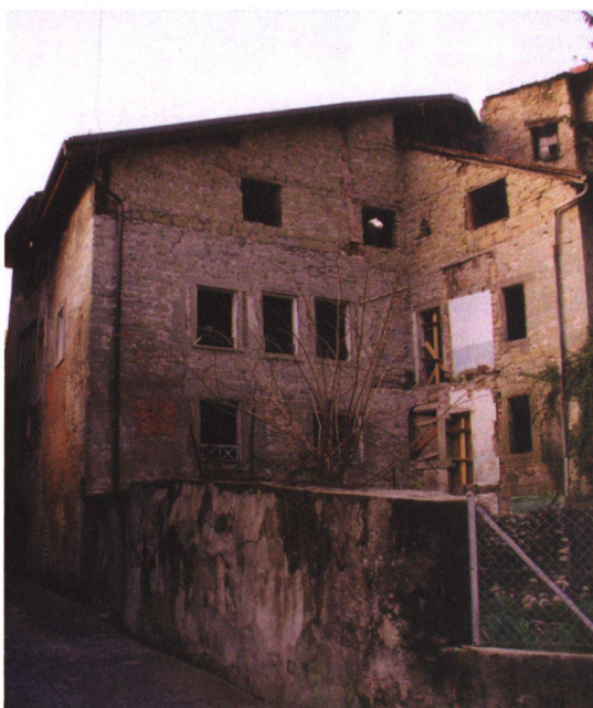
La façade est avant la transformation