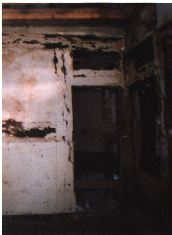
L'espace central avant et après les transformations