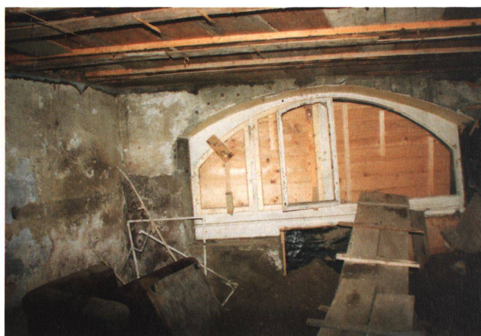
Une chambre côté rue, avant, pendant et après les transformations de l'intérieur et de l'extérieur