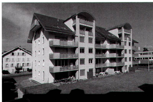
Immeuble de 22 logements sis à la rue de l'Industrie 20-22 à Bussigny, construit en 2003-04.