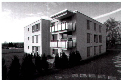
Immeuble de 26 logements sis à la route de Lausanne 44-46-48 à Bussigny-près-Lausanne, construit en 2000-01.