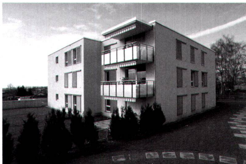
Immeuble de 26 logements sis à la route de Lausanne 44-46-48 à Bussigny-près-Lausanne, construit en 2000-01.