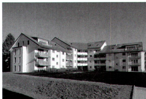
Immeuble de 30 logements sis à la rue J.-A. Venel 27 à 33 à Yverdon-les-Bains, construit en 2003-04

Jusqu'à présent, la totalité de nos habitations est en logement subventionné. On commence toutefois à constater que des communes souhaitent soutenir une mixité d'habitation. Sur un lotissement de 45 logements, par exemple, elles aimeraient avoir 8 logements hors subventions, mais à prix coûtant par