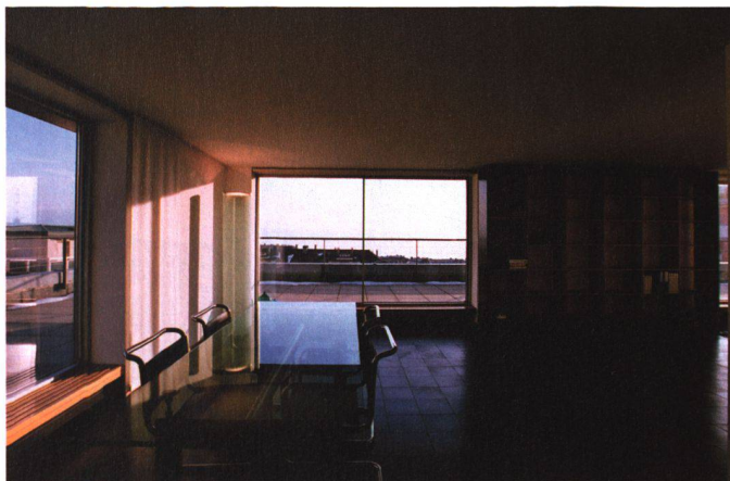
Les trois cadrages selon les différentes orientations de la zone jour, avec vue sur les toitures et le lac

Lorenz Bräker: J'étais à la recherche à la fois de locaux pour mon bureau d'architecture, mais également d'un logement, quand l'occasion s'est présentée de louer un espace, qui, dès sa construction, avait servi de bureau d'architecture, au numéro 7 du chemin des Trois-Rois, à Lausanne. Cet espace, relevant d'une typologie d'immeuble des années 30, était relativement difficile à aménager en bureau, mais en le visitant, je me suis rendu compte que le 6 ème étage, en attique, présentait un potentiel et une belle occasion de réunir un espace de travail et un logement, juste au-dessus. Le maître d'ouvrage a rapidement été convaincu que le projet de transformation de l'attique constituait une valorisation intéressante non seulement du dernier étage, mais encore de l'immeuble tout entier.