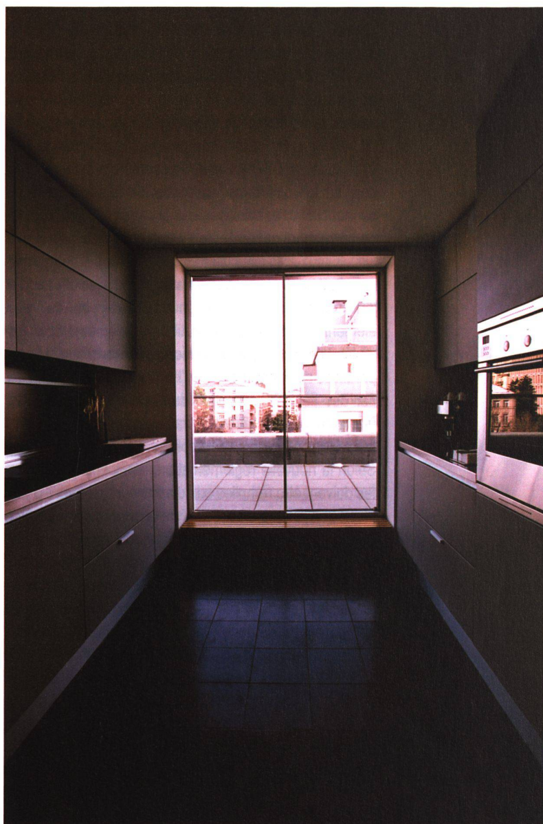
La cuisine ouverte sur la terrasse à l'est