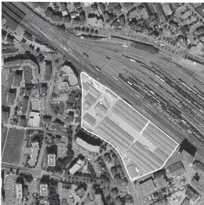
A côté de la gare de Renens, une des propriétés CFF les plus intéressantes

Aux CFF, les discussions internes progressent vers une reconnaissance de ce secteur comme potentiellement aussi intéressant pour du logement que pour des bureaux ou des commerces.