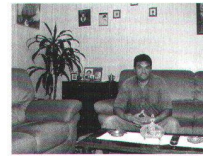
Famille Barone 3ème étage

domicile précédent: 3 pièces dans le même immeuble (échange spontané)