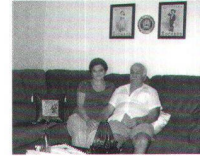
Famille Teksen 4ème étage

domicile précédent: 3 pièces dans le même immeuble (changement sur demande)