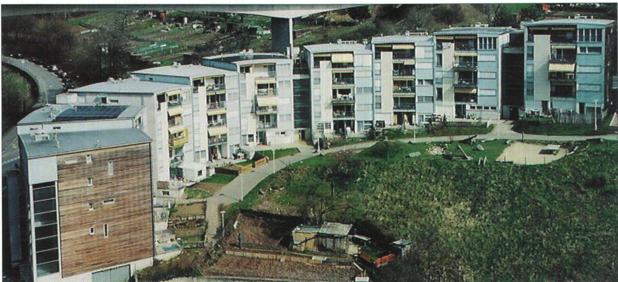
(1) - A l'heure où nous mettons sous presse, plus de quatre ans après les événements, le juge informateur n'a toujours pas rendu son arrêt.