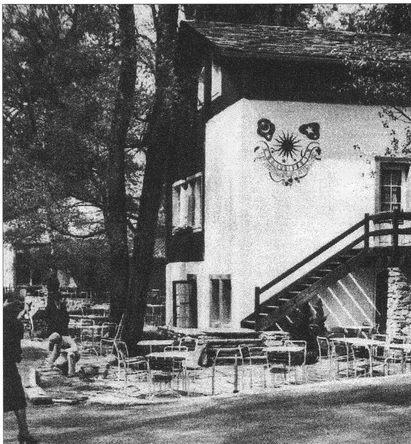
A l'Expo de Zurich de 1939

enève 1896, Berne 1914, Zurich 1939, Lausanne 1964... A moins d'une année de l'ouverture d'Expo 02, il vaut la peine de revenir sur les grandes expositions, ces "bateaux ivres des sociétés industrielles", comme les appelle l'historien Hans Ulrich Jost (1). A leurs dé- buts, ces expositions s'inscrivent dans la tradition des grandes foires du Moyen Age et sont es- sentiellement une occasion de vendre directement les produits de l'industrie, de cultiver le rap- port au client. Très vite pourtant, elles se transforment en opéra- tions de promotion de l'écono- mie nationale, en "grand-messe du capitalisme industriel".