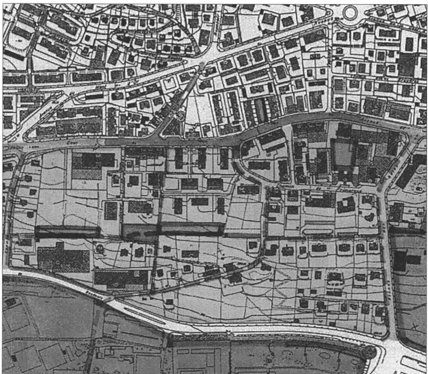
Propositions d'aménagement pour le quartier de l'avenue de Cour