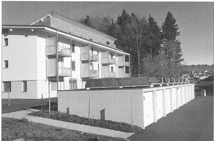
Ci-dessous : les accès et garages, avec les panneaux solaires