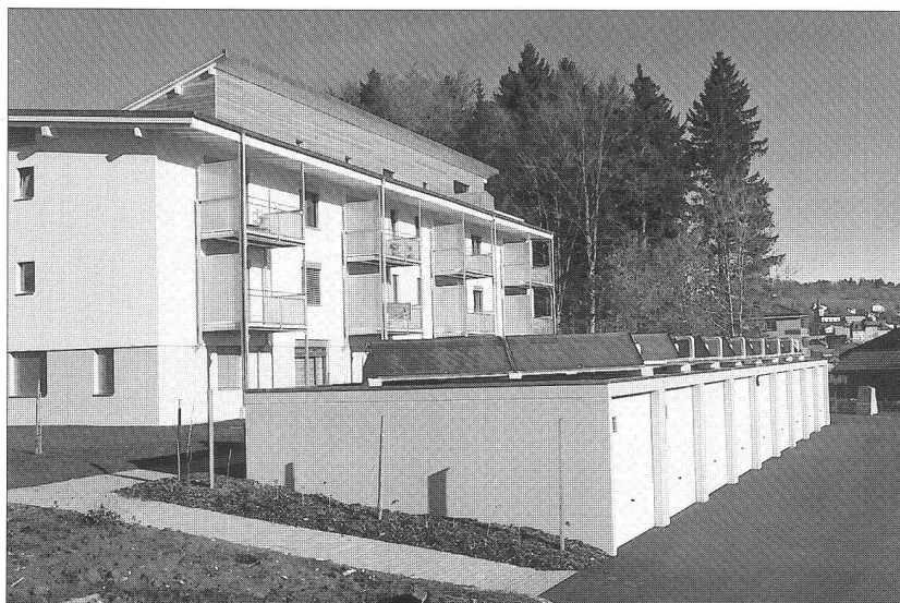
Ci-dessous : les accès et garages, avec les panneaux solaires

Parmi les originalités de cette réalisation, on doit souligner l'installation de 32 m 2 de capteurs solaires et un accumulateur de 2000 litres d'eau sanitaire « gratuite ». En treize mois de travaux les constructeurs ont réalisé 1700 m 2 de plancher. En cubage SIA ce chantier a représenté, sans les garages, 4600 m 3 . Ct