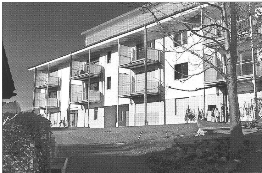
Ci-dessous : la façade et les balcons rapportés

Le détour par la fédération jurassienne qui se développa de façon spectaculaire dans cet arc horloger qui va de Soleure à Neuchâtel en passant par « les hauts » du canton de Neuchâtel et les régions voisines n'est donc ni fortuit, ni gratuit. Il explique et anticipe ce qui ne peut se limiter, étant donné