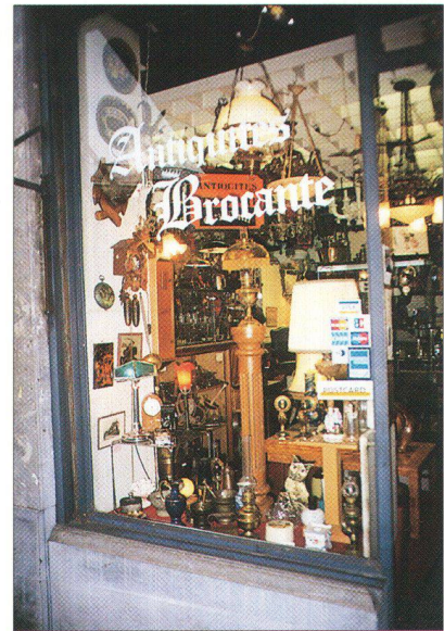
... ou par le foisonnement et l'insolite

Le rôle d'une vitrine c'est d'attirer l'attention du passant afin de l'inciter à entrer. De manière schématique, deux stratégies s'affrontent. Certains magasins font de la décoration de leur vitrine un véritable art urbain : mise en scène spectaculaires, voire provocatrices, ces tableaux (parfois animés) n'ont pas pour vocation de fournir un information sur les produits, mais d'interpeller le badaud, de titiller sa curiosité. L'appât c'est le