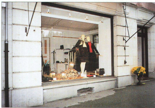
Une invitation à entrer...par simplicité et le bon goût...

antagonistes peuvent être observés : - le promoteur conçoit son bâtiment comme un objet autonome. Ce type de construction cherche moins le contact avec l'espace urbain que de se distinguer de son environnement par une architecture clinquante qui privilégie la perception éloignée plutôt que la relation de proximité. Le rapport avec la rue est laissé à sa plus simple expression. Par contre, l'entrée du parking souterrain est traitée avec emphase... - lors de certaines transformations, notamment lorsqu'elles concernent des maisons villageoises, les ouvertures du rez-de-chaussée se font sans une prise en compte de l'architecture de la façade et de la relation entre les vides et les pleins.