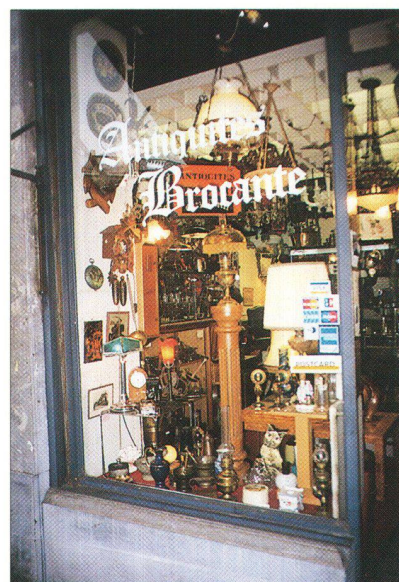
... ou par le foisonnement et l'insolite

Le rôle d'une vitrine c'est d'attirer l'attention du passant afin de l'inciter à entrer. De manière schématique, deux stratégies s'affrontent. Certains magasins font de la décoration de leur vitrine un véritable art urbain : mise en scène spectaculaires, voire provocatrices, ces tableaux (parfois animés) n'ont pas pour vocation de fournir une information sur les produits, mais d'interpeller le badaud, de titiller sa curiosité. L'appât c'est le