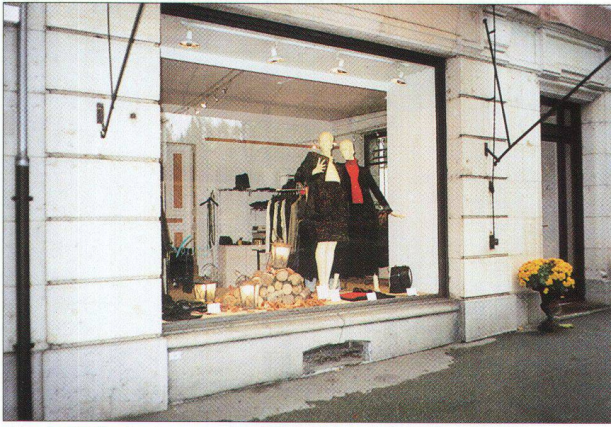
Une invitation à entrer...par simplicité et le bon goût...

antagonistes peuvent être observés : - le promoteur conçoit son bâtiment comme un objet autonome. Ce type de construction cherche moins le contact avec l'espace urbain que de se distinguer de son environnement par une architecture clinquante qui privilégie la perception éloignée plutôt que la relation de proximité. Le rapport avec la rue est laissé à sa plus simple expression. Par contre, l'entrée du parking souterrain est traitée avec emphase... - lors de certaines transformations, notamment lorsqu'elles concernent des maisons villageoises, les ouvertures du rez-de-chaussée se font sans une prise en compte de l'architecture de la façade et de la relation entre les vides et les pleins.