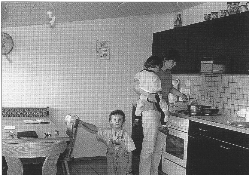
La cuisine lieu de tous les dangers