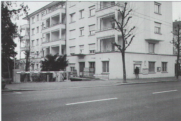
immeuble d'habitation avec pignon sur rue et le bureau de la Poste au rez