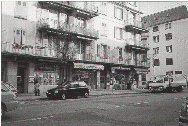
immeuble d'habitation offrant une alignée de magasins