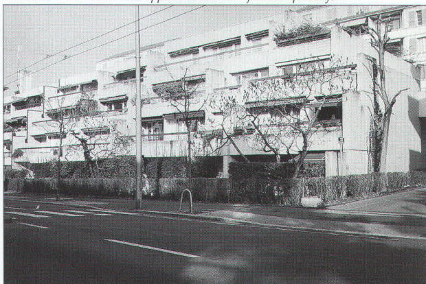
immeuble «Philip Morris» dont l'entrée est en contrebas par rapport à la rue