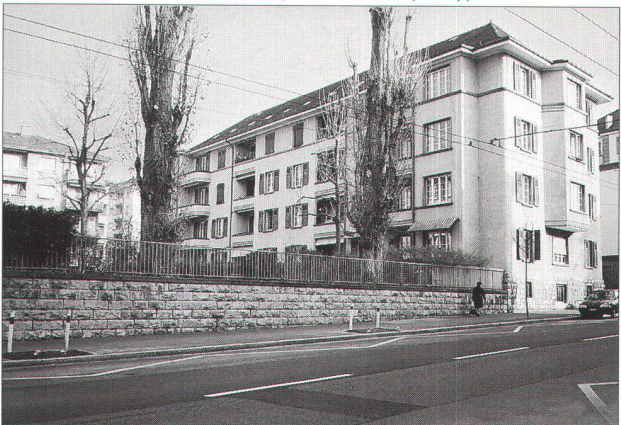
immeuble «Police» en retrait par rapport à la rue avec un espace de verdure résiduel de vant l'immeuble