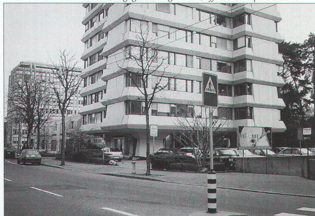
immeuble d'angle avec bureaux, présentant un pignon sur rue (l'entrée représentative étant située sur la rue perpendiculaire)