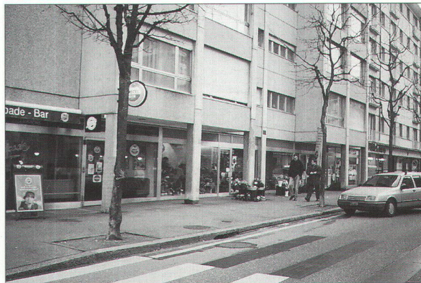
immeuble tour avec bureaux, dégagé de l'alignement, offrant un espace d'accès