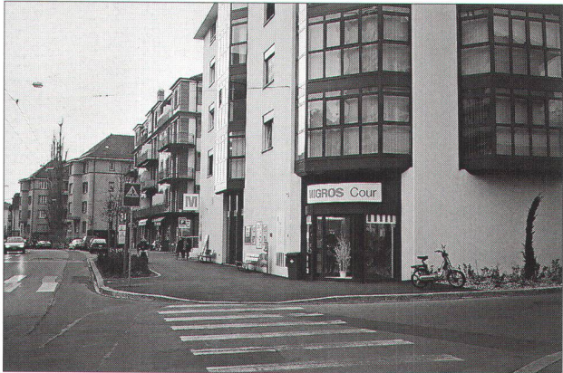
immeuble MMM présentant un pignon fermé à la rue