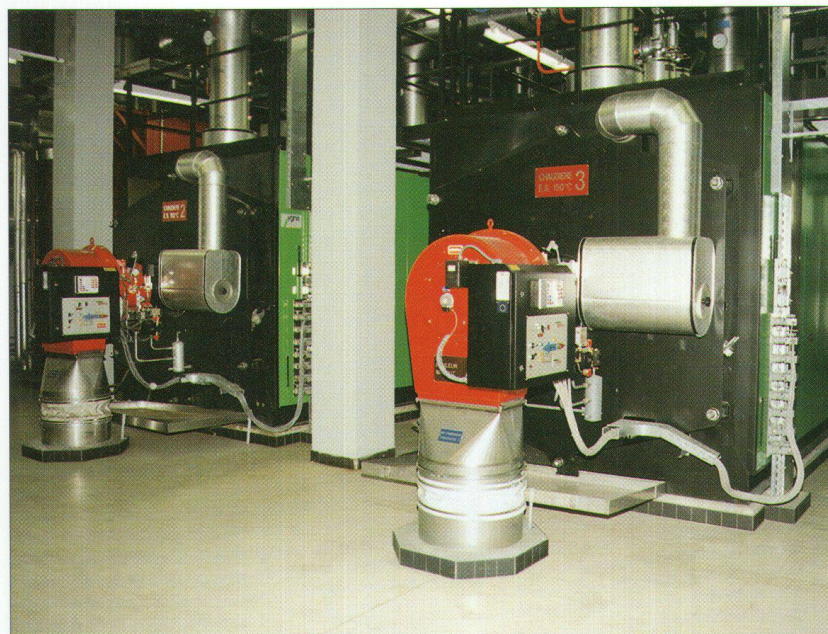
Chaudières et brûleurs