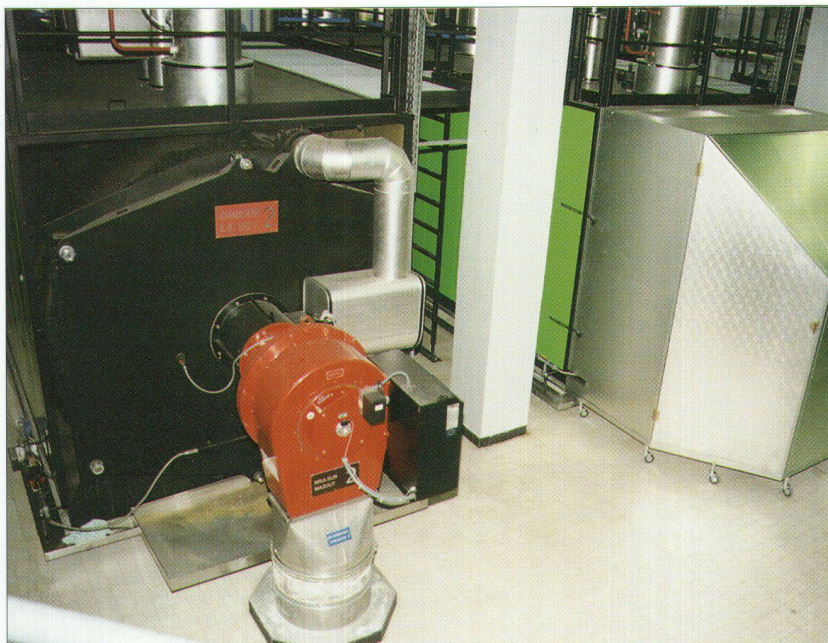
Installation production d'énergie avec et sans capot isolant insonorisant