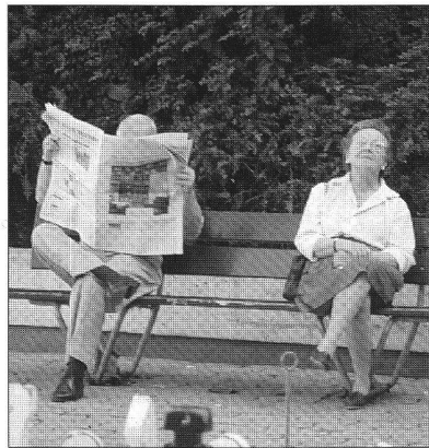
banc pour boudier