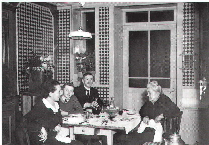
Un intérieur de classe moyenne dans les années vingt. Le fauteuil était un luxe et le salon une rareté. Depuis les mœurs ont changé. Les mœurs commerciales aussi...

soin de s'organiser mais le désordre de la distribution est devenu si violent, les pratiques agressives à ce point répétées qu'en très peu de temps une cinquantaine d'entreprises spécialisées dans la distribution de meubles, de la grande comme Pfister, à la moyenne unité ont décidé de rejoindre, en Suisse romande, les rangs de l'ARPA. L'une des premières tâches des professionnels organisés fut d'instituer une relation permanente avec la Fédération romande des consommatrices qui leur signale les cas où le rapport qualité-prix en matière de meubles a été foulé au pied. Par ce canal, arrivent chaque année plusieurs centaines de plaintes qui témoignent de pratiques déshonnêtes, évidemment négatives pour la corpo-