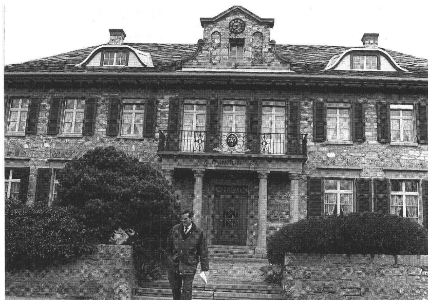
Ci-dessus, élévation sud des maisons d'ouvriers n°s 1 et 3. Ci-contre, Le Foyer, une construction symbolique pour le repos de l'ouvrier.

En 1927, la société construit l'importante maison du pont, trois étages et combles, qui accueillera quelque temps, au rez-de-chaussée, les cours des apprentis. Au fil des demandes et jusqu'en 1940, elle construira encore quelques villas destinées à loger un personnel d'enca-