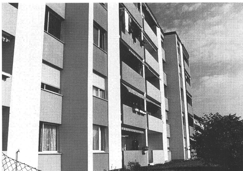
Un des objets de la sixième action HLM : l'immeuble des Noyers 37, 39