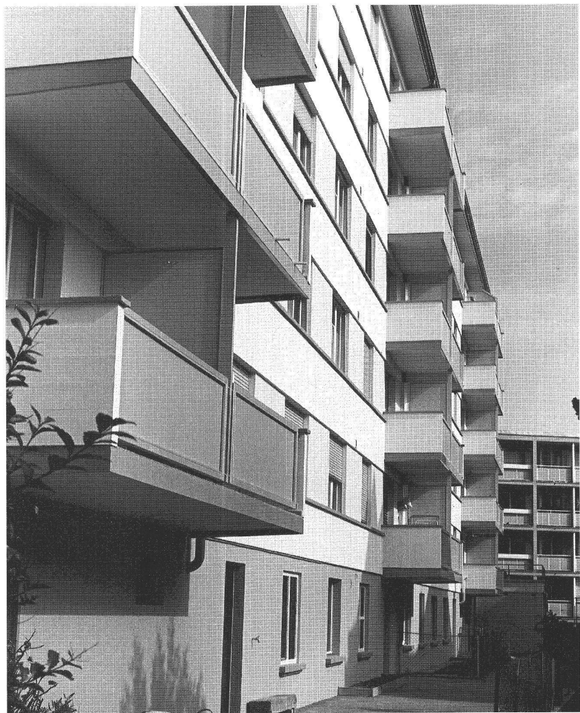
Les façades Sud et Est de l'immeuble des Charmettes reprises récemment par les maîtres d'état. Ci-dessus, le secteur Pain Blanc 1 et 3, une construction de la première action HLM que la Coopérative a rénovée en 1995.

«Une commission cantonale - précise René Jeanneret - devait déterminer les critères d'un appartement HLM (...) surfaces habitables (...) qualité de l'isolation thermique et phonique. (...) Le Conseil d'Etat a décidé (...) d'adjuger au groupe d'entreprises qui serait capable de construire le plus grand nombre possible d'appartements de la meilleure qualité pour les dix millions de crédits à disposition. (...) C'est un consor-