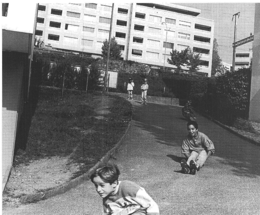
En avant-plan, l'immeuble du Pain Blanc et, en arrière-plan, celui des numéros 6 et 8 de la rue des Troncs : rien de tel que les enfants pour animer l'espace.

Coopérative d'habitation, lieu de convergence des syndiqués, particulièrement ceux qui viennent des rangs de l'ancienne FOBB (Fédération des ouvriers du bois et du bâtiment), aujourd'hui SIB (Syndicat de l'Industrie et du Bâtiment), MON LOGIS est tout cela et plus encore : une entité économique qui a trouvé le soutien, parfois inattendu, des pouvoirs publics.