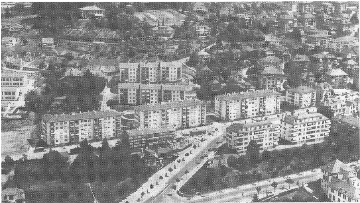
Vue générale du quartier du Mont d'Or au début des années cinquante. Les trois immeubles de la Coopérative FTMH et les deux «jumeaux» de Bon Abri sont bien alignés, au cœur de la photo (archives Coop FTMH).

nous ont été accordées que pour trois des cinq bâtiments prévus sur le terrain acheté...) nous avons été dans l'obligation de créer deux sociétés, l'une sous la forme coopérative pour les terrains A B C et une seconde sous la forme d'une société immobilière, pour les deux derniers blocs D et E.»