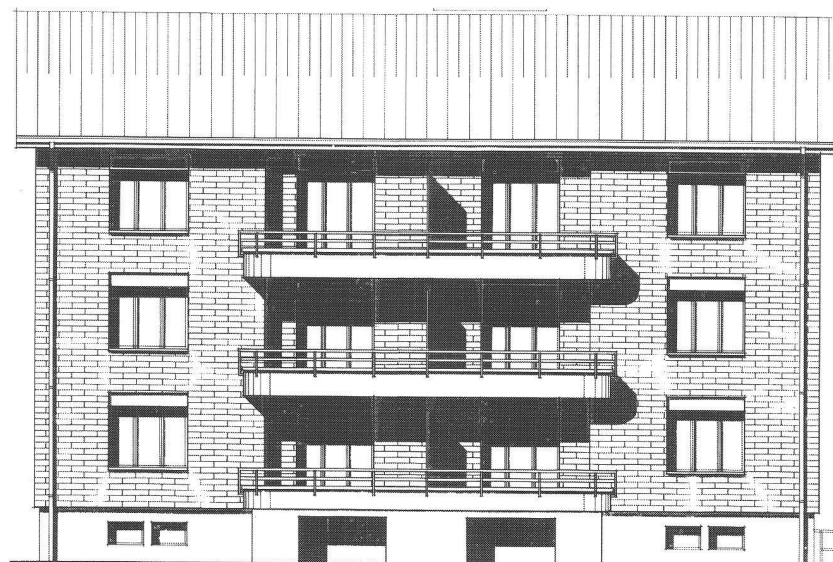
La transformation de l'immeuble de la rue de la Paix, façade Sud, d'après les plans de l'architecte Serge Farine.

C'est un peu par hasard que la coopérative SORALI, seize logements à Courtételle, va entrer dans la galaxie syndicale. A sa naissance, en 1967, elle illustre une sentence célèbre de l'anglais Samuel Johnson selon laquelle «l'enfer est pavé de bonnes intentions». Ils débordent de bonnes intentions ces villageois qui construisent – un peu léger! – seize logements pour garder les jeunes au village. Ils sont pétris d'angélisme ces électeurs las d'une si longue division entre «rouges» et «noirs», qui baptisent leur coopérative avec les deux premiè-