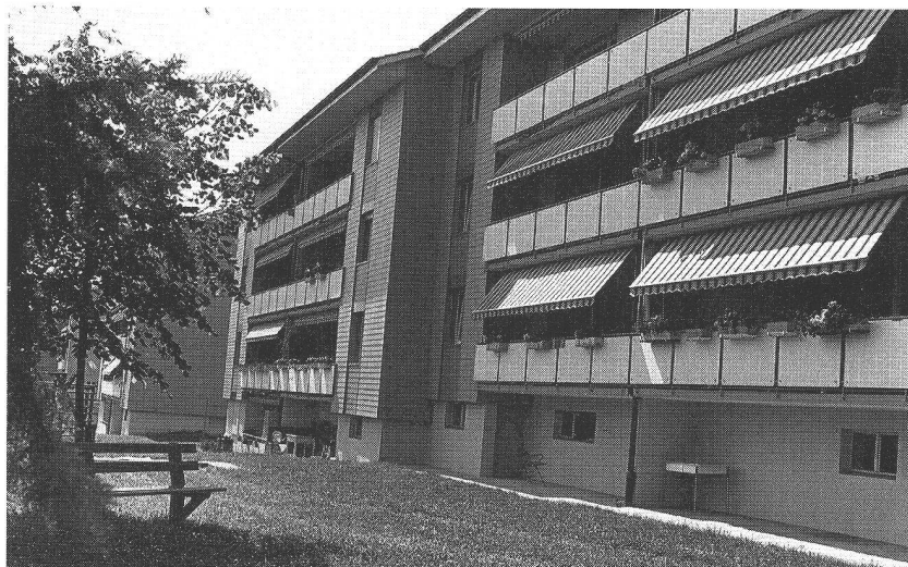
Surgi voilà près de quarante ans au-dessus des pâturages, le vieux Champois en a gardé un peu du charme agreste.