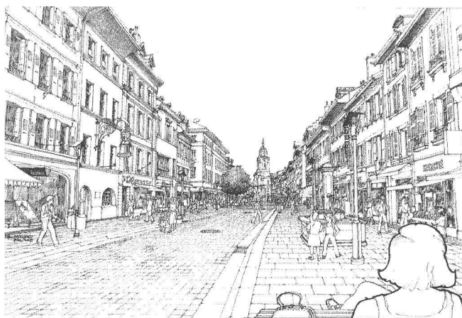
Le projet de la Grande Rue dessiné par son architecte, Gabriel de Freudreich