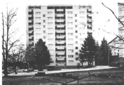
Fribourg, route du Jura 22-32 Maître de l'ouvrage : Société coopérative La Solidarité