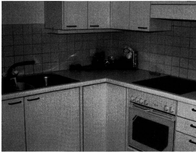
Ci-dessus, standard suisse ; ci-dessous, standard allemand