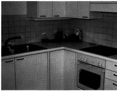
Ci-dessus, standard suisse ; ci-dessous, standard allemand