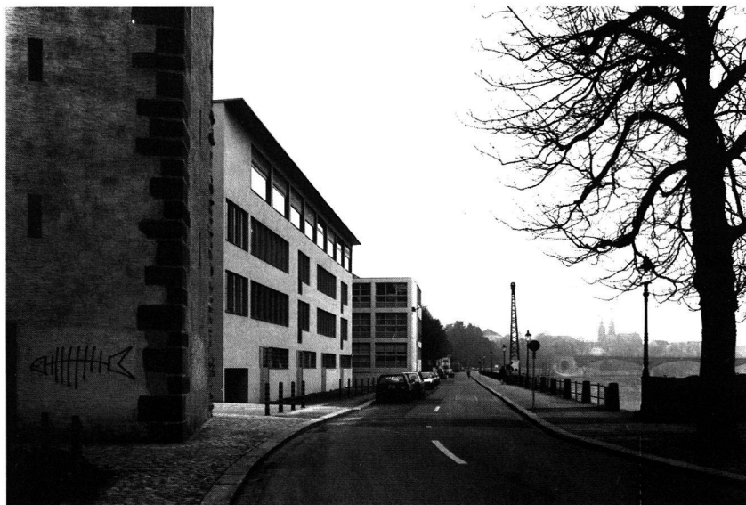
Assainissement du St. Albantal. Logements au Canal supérieur. Arch. Diener + Diener, Bâle.

Cette mutation est ressentie par un grand nombre d'architectes et aussi par d'autres gens comme une remise en question néfaste de dogmes irrévocables. Les symptômes du Postmoderne (nostalgie, architecture de citations, protection des monuments, small is beautiful ), remettent en question le Moderne en tant que processus ultime, décisif et social. Si l'on avait pu ne plus traîner derrière soi ces boulets, on aurait enfin pu construire la ville idéale. Je pense que le Mouvement moderne a échoué en adoptant cette attitude par rapport à la ville: l'urbanisme de la culture «moderne» a rejeté la ville existante. On voulait construire pour l'homme de demain une ville nouvelle mieux adaptée aux besoins du futur. Si l'on se disputait au sujet de la méthode, tous, les capitalistes avec leur approche technique, les socialistes avec leur approche sociale ou les marxistes avec leur approche économique, étaient d'accord quant à la nécessité de faire autre chose: démolir la ville ou s'en aller dans les villes jardins, ou encore aplanir les inégalités entre ville et campagne. Mais tous ont ignoré les lieux particuliers, la faculté d'émotion de l'homme, le continuum passé-futur. Construire dans la ville était un acte rationnel. La discussion culturelle se limitait à des questions de pure esthétique.