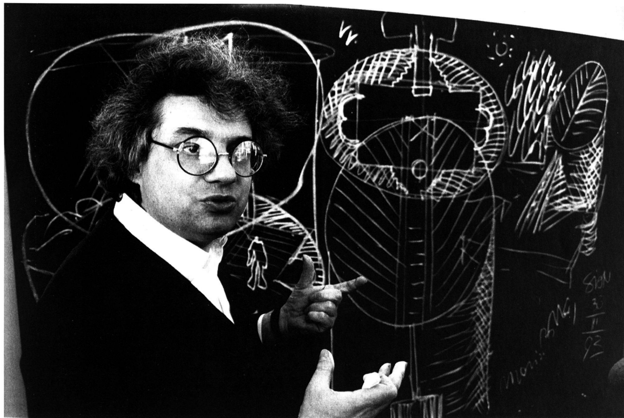
Mario Botta devant son dessin à la craie, à la galerie municipale de la Grenette, à Sion