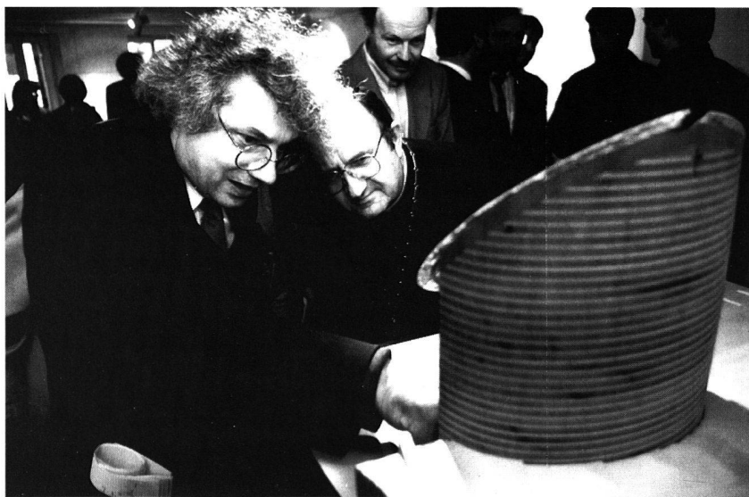
Mario Botta et Son Eminence Henri Cardinal Schwery devant la maquette.