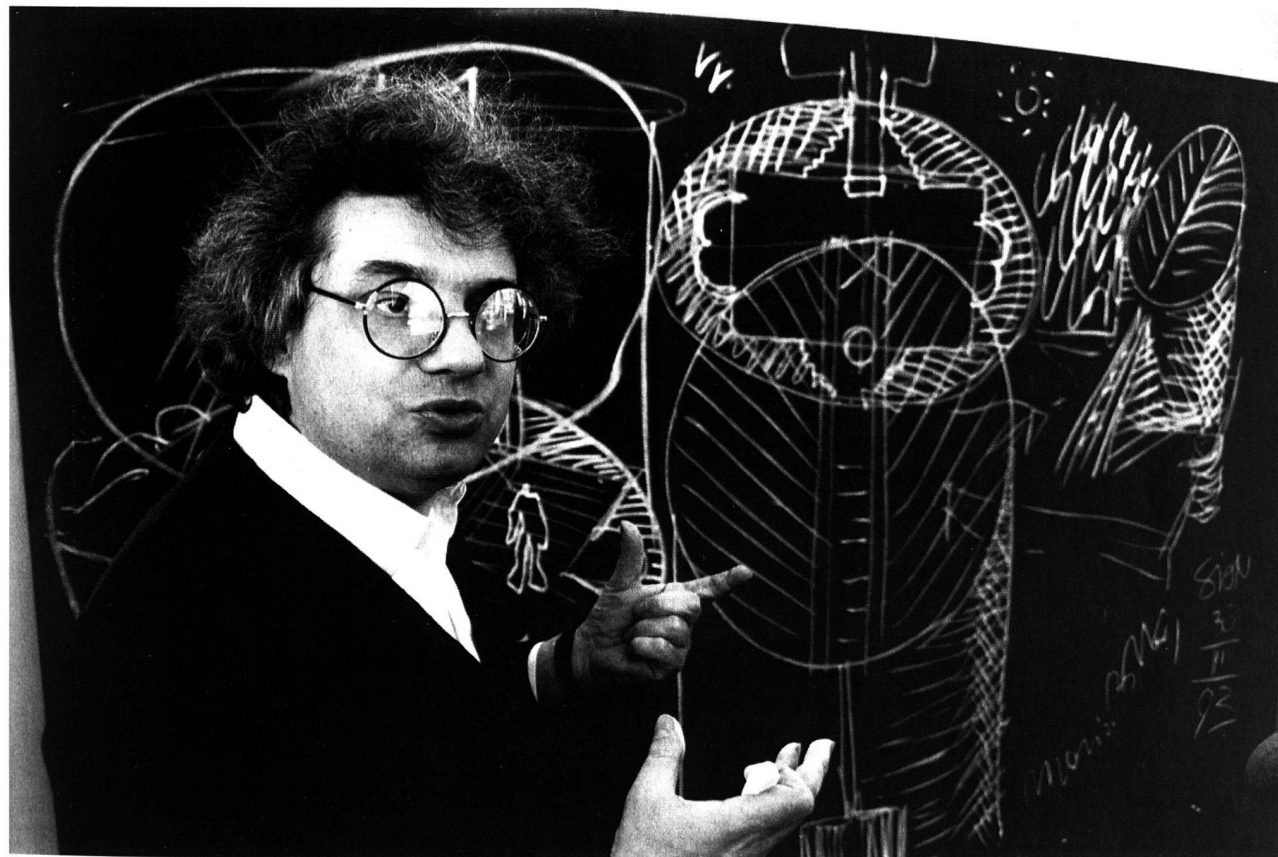
Mario Botta devant son dessin à la craie, à la galerie municipale de la Grenette, à Sion