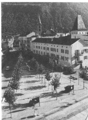
Place Vaison-la-Romaine, Martigny, architecte Roni Roduner, 1986.

Le Prix des villes valaisannes doit, lui, être décerné à la réalisation considérée comme la meilleure contribution à l'architecture de la ville.