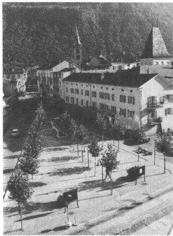
Place Vaison-la-Romaine, Martigny, architecte Roni Roduner, 1986.

Le Prix des villes valaisannes doit, lui, être décerné à la réalisation considérée comme la meilleure contribution à l'architecture de la ville.