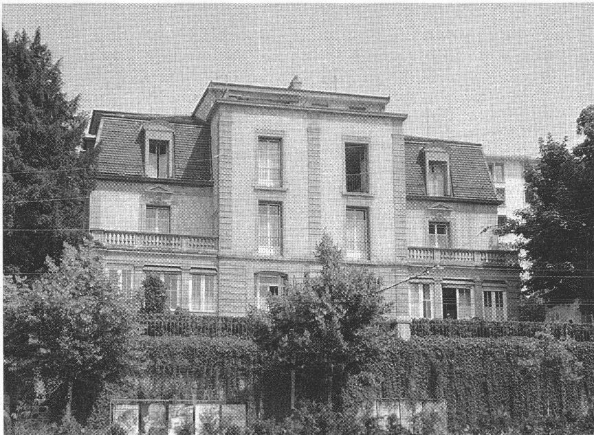
Avenue de la Gare 14-16, la rénovation est imminente...