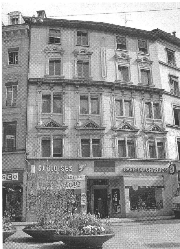
Derrière la belle façade du N° 21 à la Palud, d'importants travaux devront être entrepris.

La Municipalité exprime ainsi son désir de maintenir intact son patrimoine immobilier.