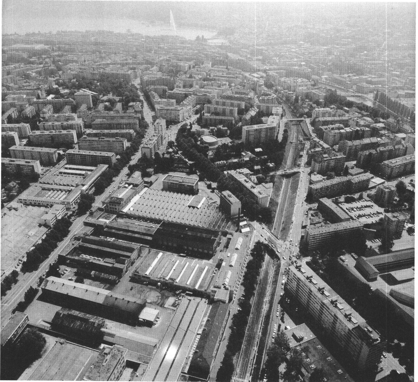
La zone industrielle des Charmilles.

freine un instant la course aux prix. Il tente de répondre aux nombreux demandeurs de logements sociaux par une offre importante d'HLM. Cette décision se fonde sur un projet du Département des travaux publics de réaliser 700 appartements, des surfaces in-