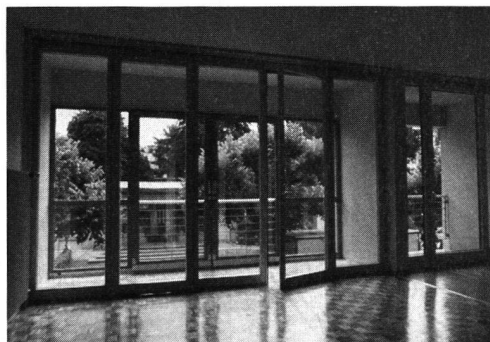
Double façade (serre), 1 er étage.

d'une prise de position de fond par rapport aux relations imitation–interprétation–innovation que la généralisation actuelle de la recherche typologique amène.