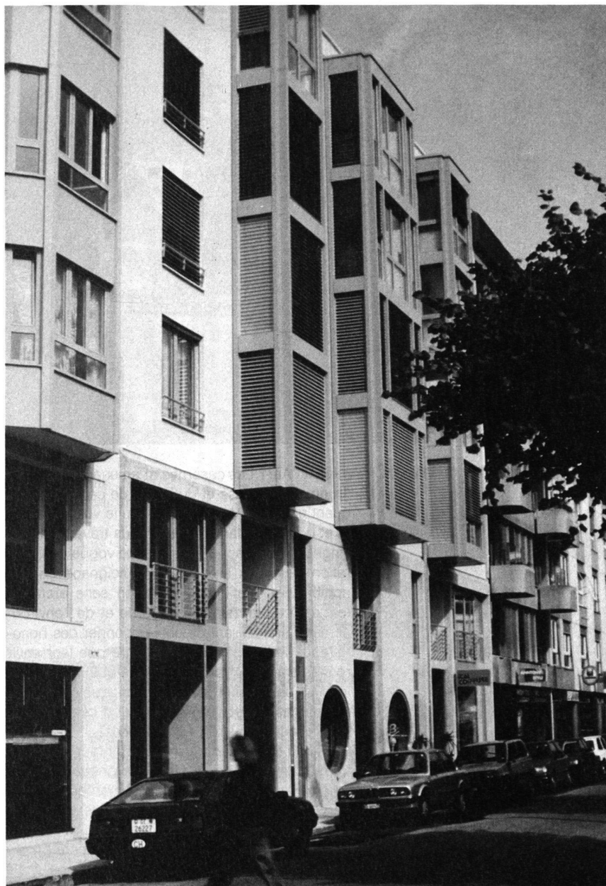
Vue boulevard de la Cluse.

L'idée que toute construction peut engendrer une quantité d'interrogations thématiques fondamentales n'est plus à démontrer. La «banalité» des «données» d'un projet – on le sait aussi bien – n'est qu'une apparence.