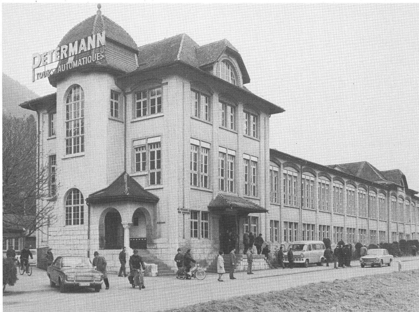
Fabrique Pétermann SA, Moutier.