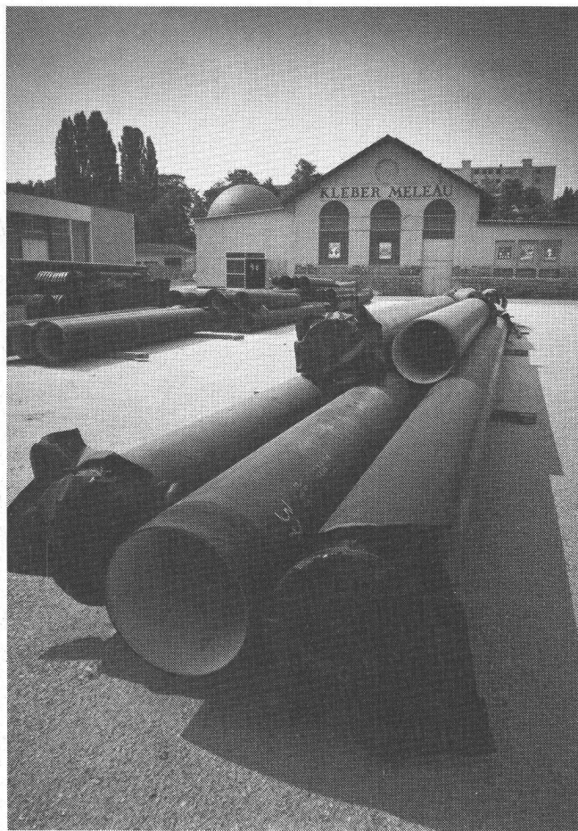
Théâtre Kléber-Méleau. Vue de la façade nord.

(Décor: Jean-Marc Stehlé)