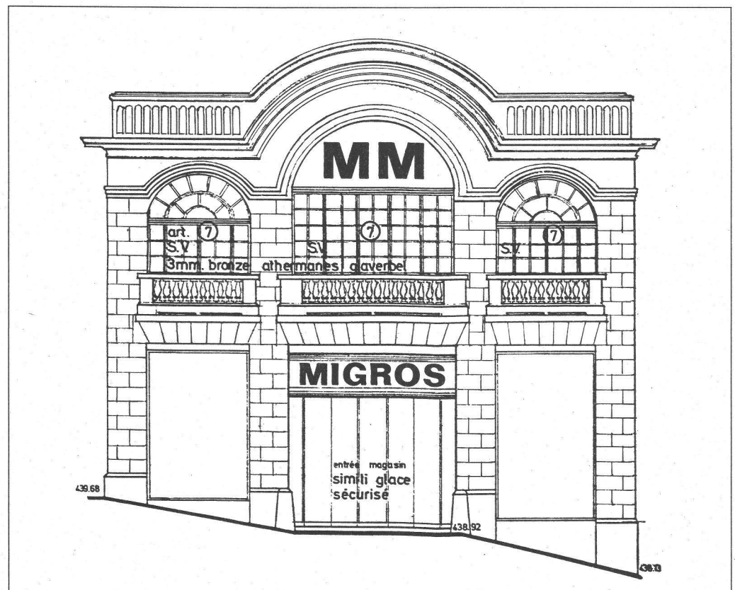
MM. Migros, 1976. Entrée principale. Architectes Adatte et Juvet.

En 1976, la maison Migros mandatait un bureau d'architectes pour transformer ce garage en supermarché MM. Le propriétaire, sur les conseils des services communaux et cantonaux pour la protection des monuments historiques, s'engageait à respecter les façades, les ouvertures et les verrières du bâtiment.