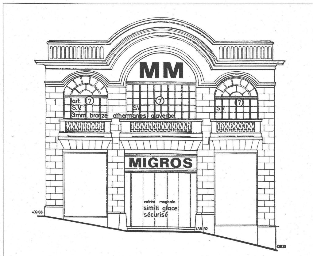
MM. Migros, 1976. Entrée principale. Architectes Adatte et Juvet.

En 1976, la maison Migros mandait un bureau d'architectes pour transformer ce garage en supermarché MM. Le propriétaire, sur les conseils des services communaux et cantonaux pour la protection des monuments historiques, s'engageait à respecter les façades, les ouvertures et les verrières du bâtiment.