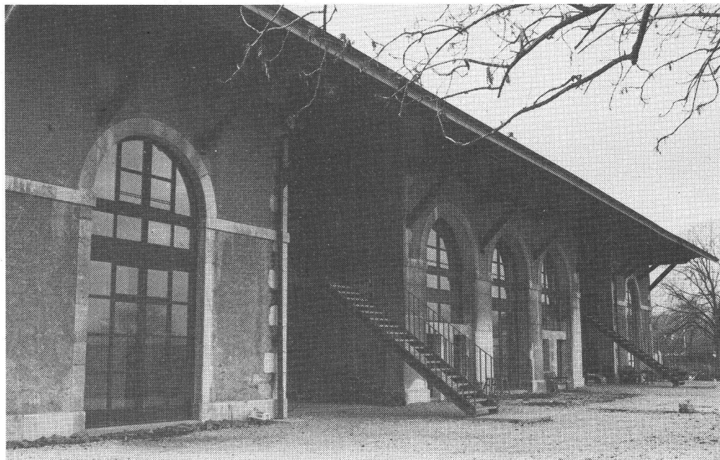
Le rural de Landecy.

La transformation du rural de Landecy redonne la vie et un sens nouveau à un bâtiment du siècle passé (1847). Ce véritable familistère offre aujourd'hui 14 logements à autant de propriétaires organisés en coopérative. Une telle opération prouve, sur le plan de la démarche architecturale, que des interventions contemporaines peuvent être belles, même si elles s'ajoutent à des œuvres anciennes.