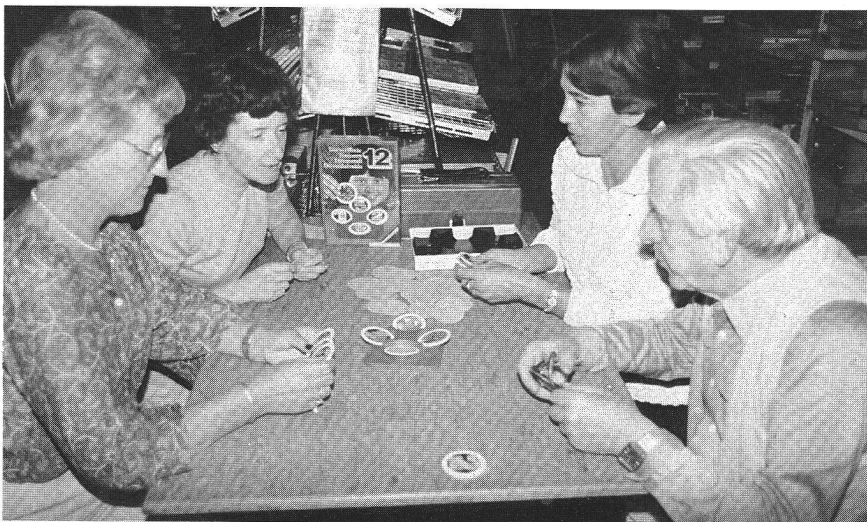
La ludothèque peut aussi être un lieu d'animation intergénérationnels.

fie... Dans ces situations, je suggère que l'enfant puisse se choisir un second jeu ou jouet pour s'amuser réellement.