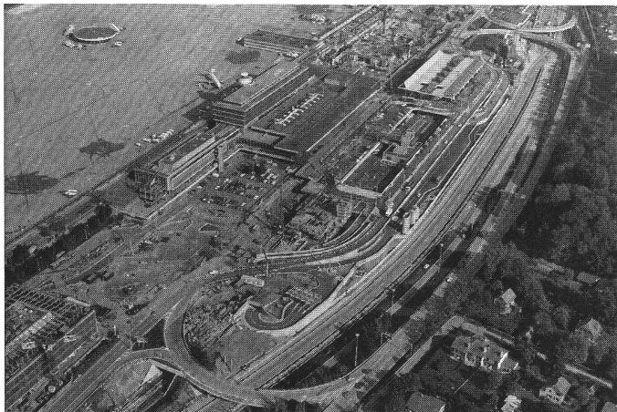
△ Aéroport de Genève-Cointrin Complexe Gare CFF, parking P1, viaducs et plate-forme. Travaux réalisés en association.

Pour le groupe, le chiffre d'affaires consolidé s'est élevé à 609 millions de francs, en augmentation de 7% par rapport à 1985 (569).