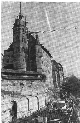
△ Hôtel de Ville de Fribourg Renforcement et réfection des murs des jardins Hertig.