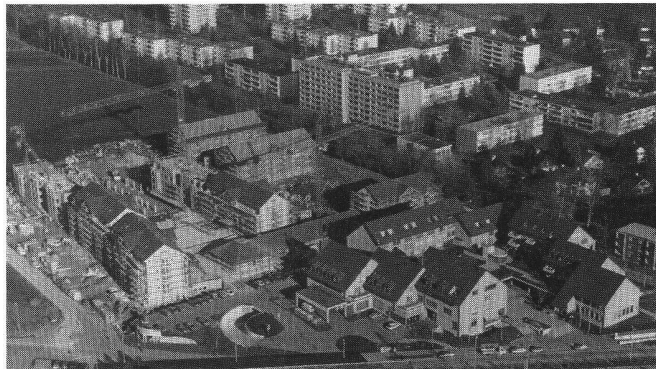
▷ Ensemble résidentiel et commercial de la Chimligasse à Scherzengasse Construction de la deuxième étape: 80 logements réalisés en entreprise intégrale.